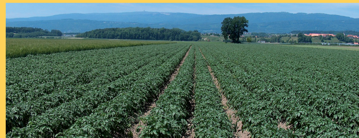
Raps oder Kartoffel