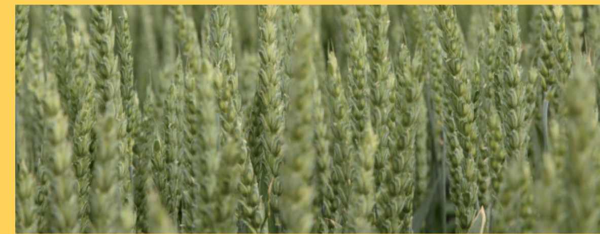
Weizen oder Gerste