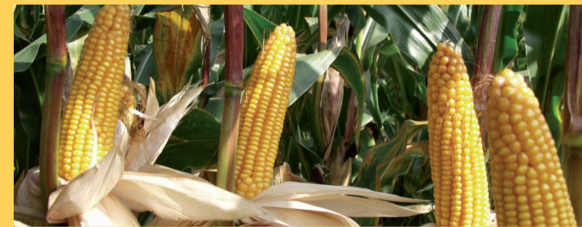
Mais oder Erbse